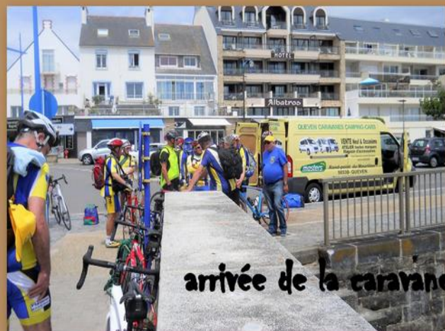
arrivée de la caravane ...