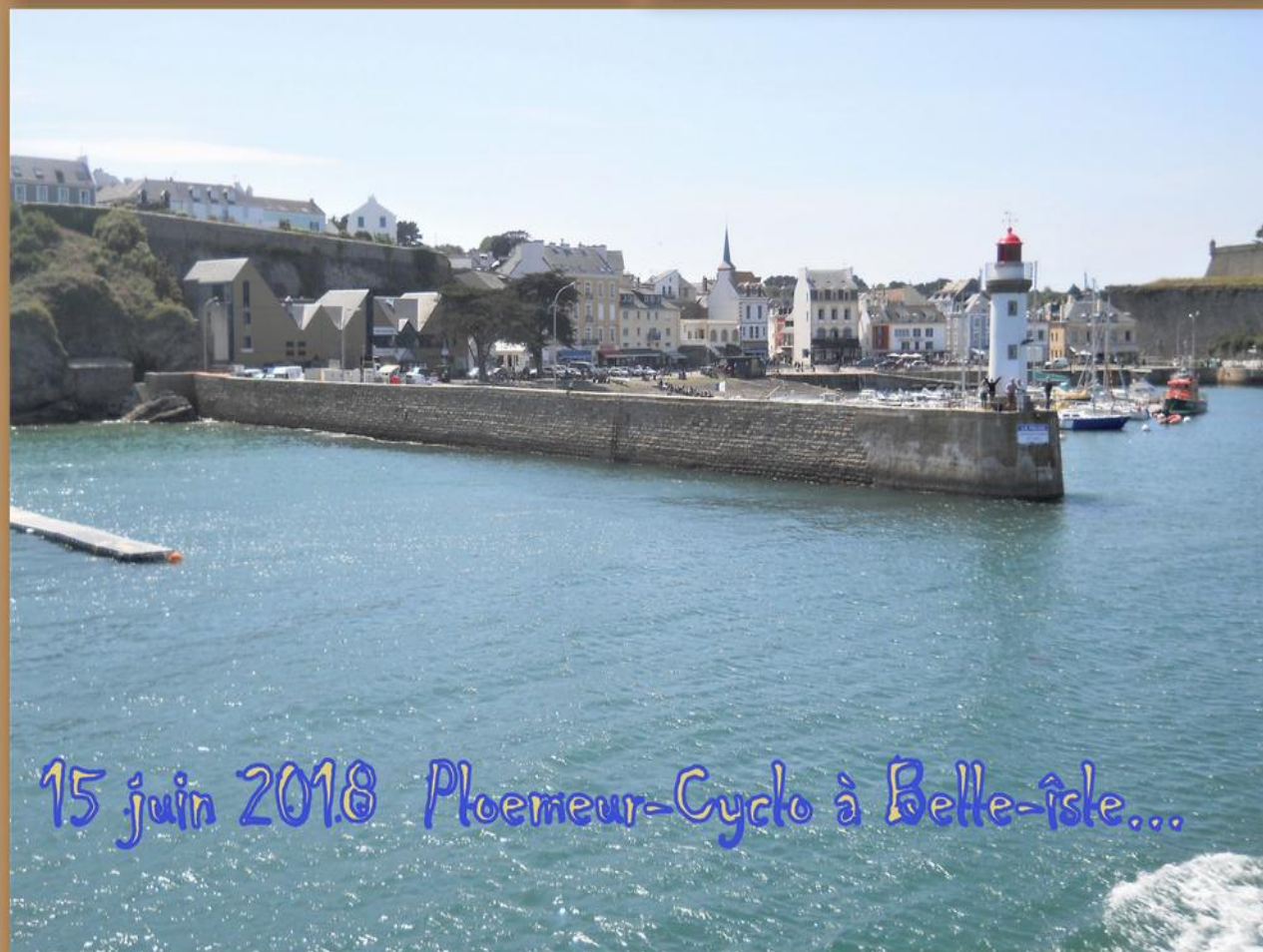
15 juin 2018 Ploemeur-Cyclo à Belle-Île...