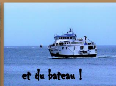
et du bateau !